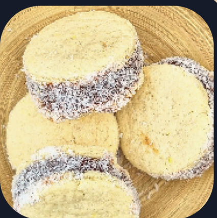
Alfajor de Maicena