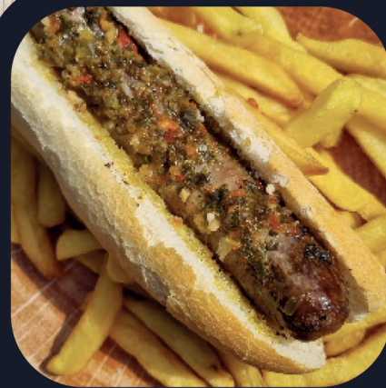
Choripan (Boeuf + Porc) + Frites