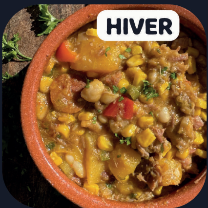
Locro (Boeuf + Porc)