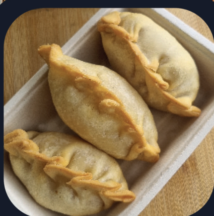
Empanadas de Humita x3 (Veggie)