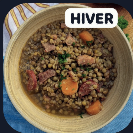
Guiso de Lentejas (Boeuf)