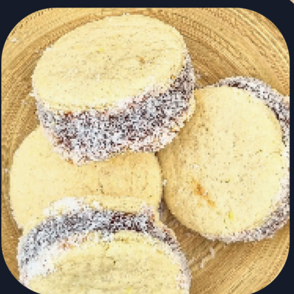
Alfajor de Maicena