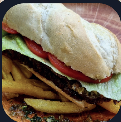
Bife Argentino (Boeuf) + Frites