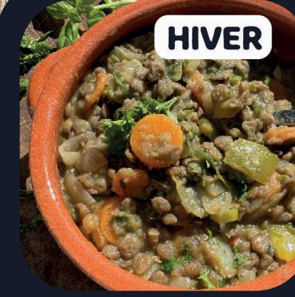
Guiso de Lentejas (Veggie)