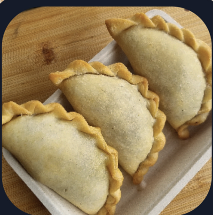
Empanadas de Carne x3 (Boeuf)