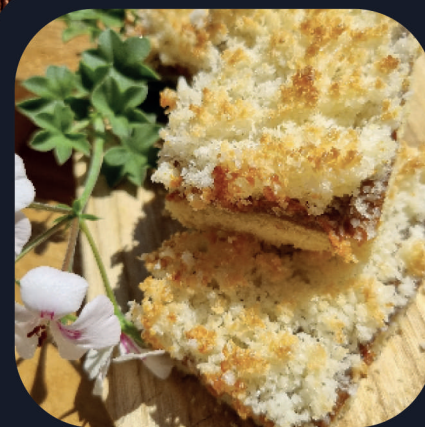
Tarta de Coco (Dulce de Leche)