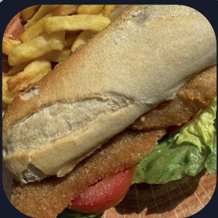
Sandwich Milanesa (Poulet) + Frites