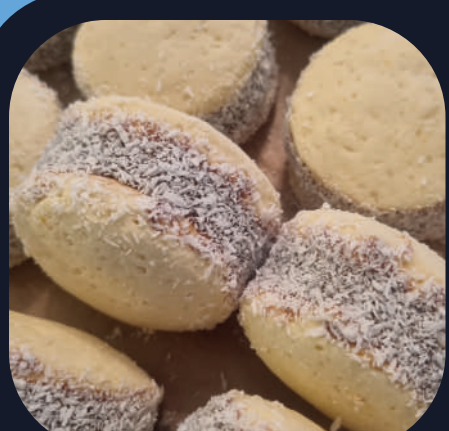
Alfajor de Maicena x5