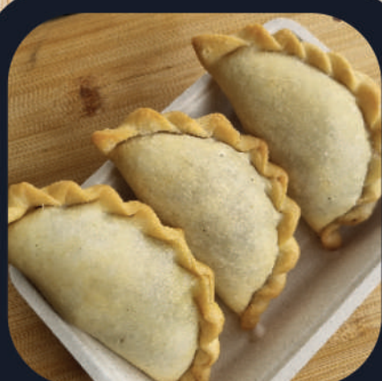
Empanadas de Carne x3 (Boeuf)