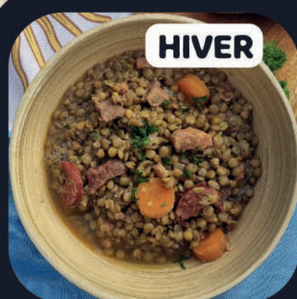
Guiso de Lentejas (Boeuf)