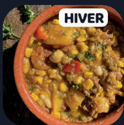
Locro (Boeuf + Porc)