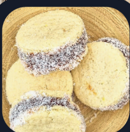
Alfajor de Maicena