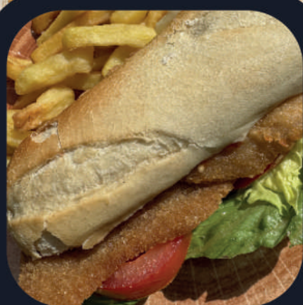
Sandwich Milanesa (Poulet) + Frites