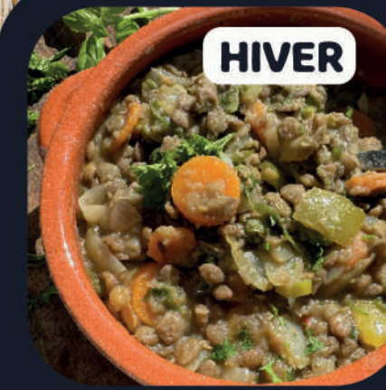
Guiso de Lentejas (Veggie)